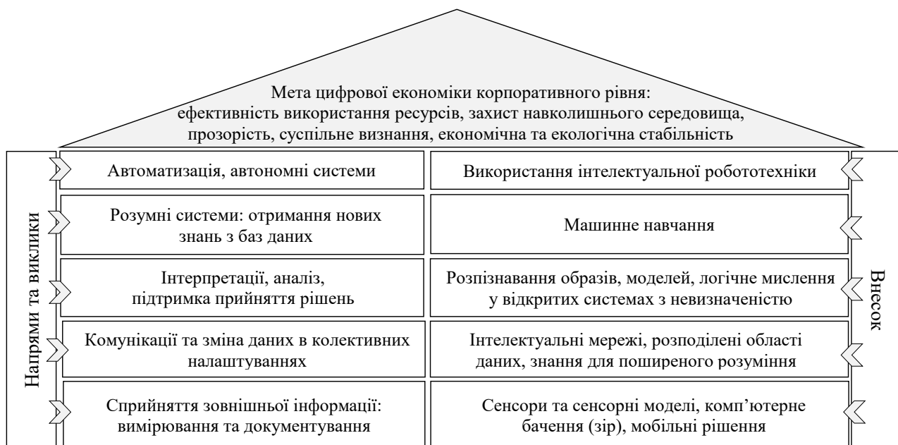
Рис. 2. Внесок штучного інтелекту до процесу досягнення мети цифровізації корпоративної діяльності