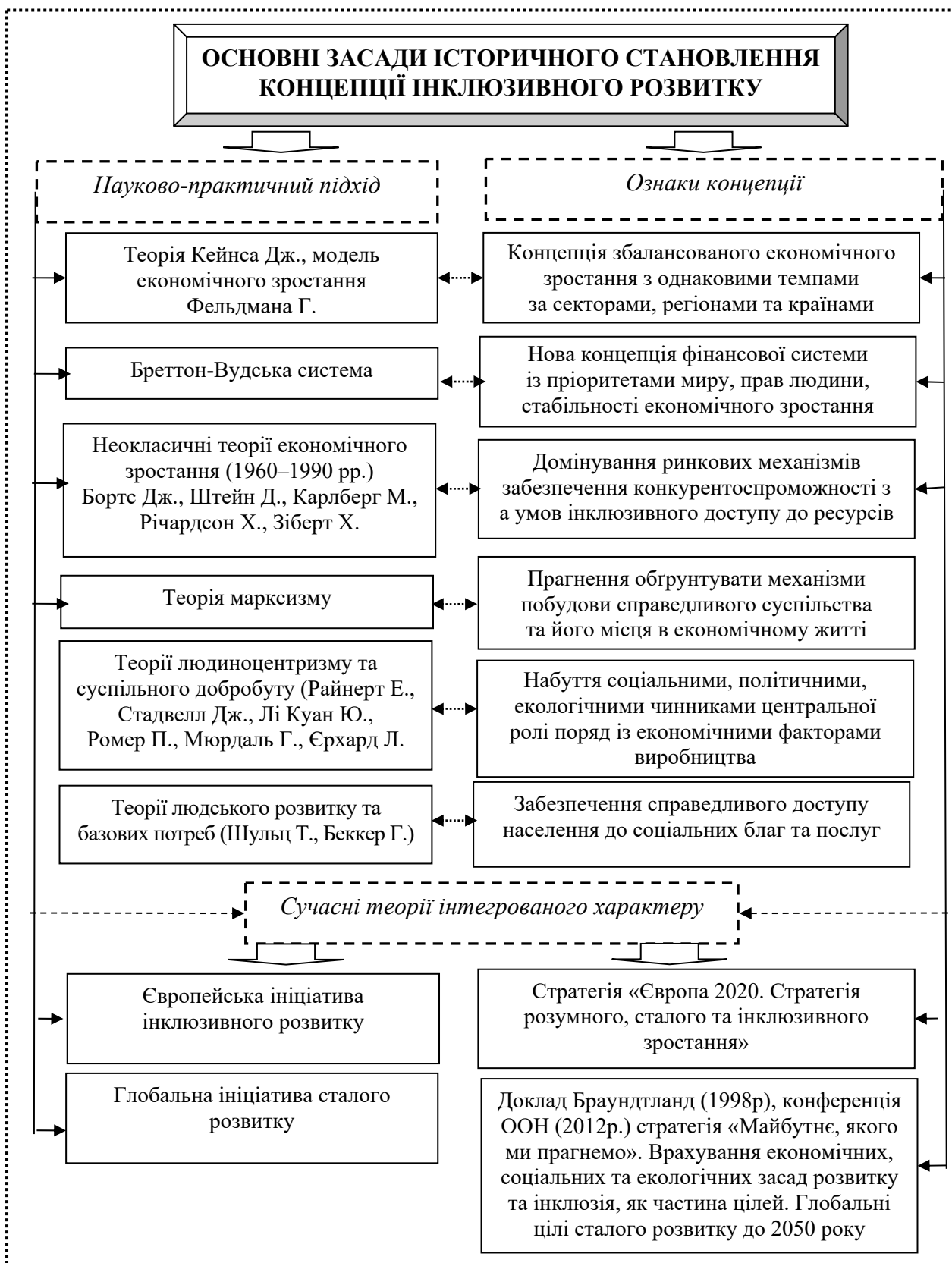
Рис. 1. Історичне становлення концепції інклюзивного розвитку економіки