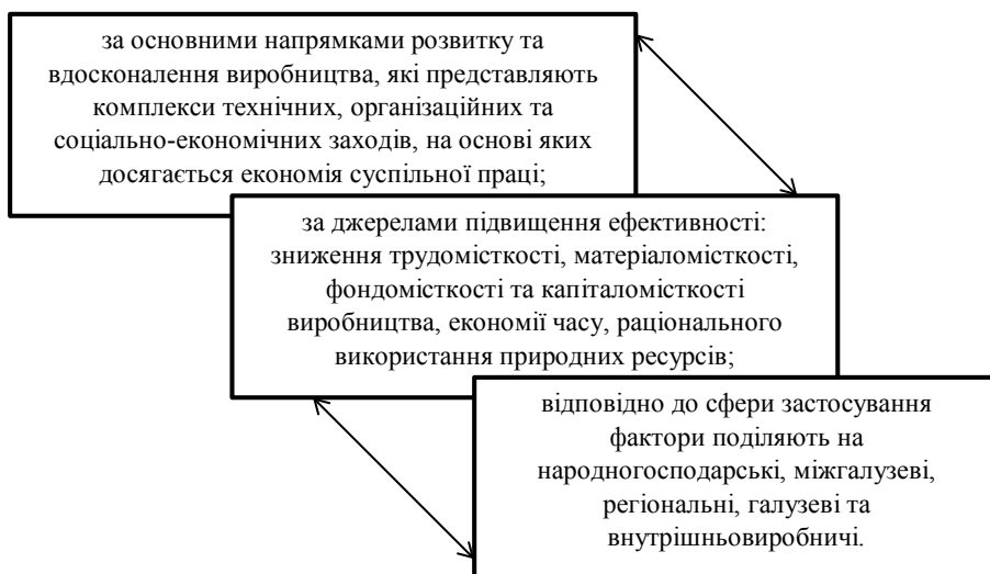
Рис. 4. Класифікація ознак підвищення ефективності ресурсного потенціалу