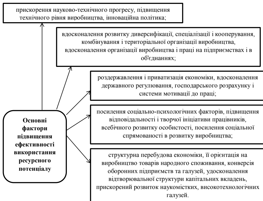
Рис. 3. Основні фактори підвищення ефективності використання ресурсного потенціалу