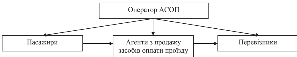
Рис. 1. Організаційна схема АСОП

Під час упровадження АСОП виникають питання стосовно видів засобів оплати проїзду, як разових, так і багаторазового використання. Світовий досвід показує доцільність використання як разових засобів оплати проїзду квитків з QR-кодом. При цьому проїзні квитки багаторазового використання доцільно застосовувати універсальні, які можуть бути використані на будь-якому виді транспорту. Відповідно, виникає необхідність удосконалення методики розподілу доходів у комбінованих проїзних квитках між різними видами транспорту та перевізниками. Нині така методика також жодним чином не затверджена, і у колах фахівців є два основних погляди на такий розподіл. Перший варіант – це розподіл доходів в універсальних проїзних квитках з однаковою