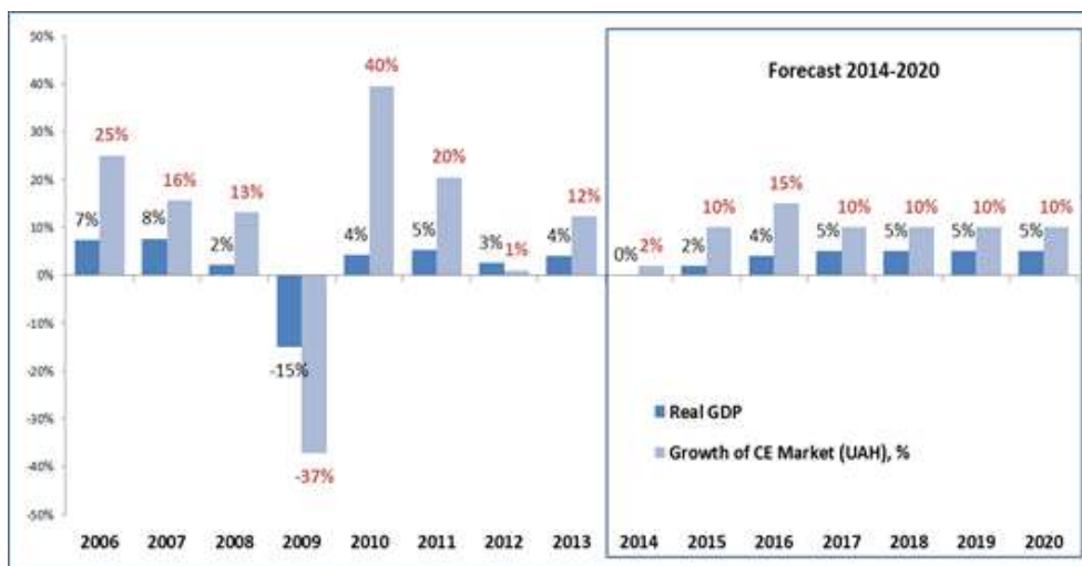
Рис. 3. Приклад прогнозування динаміки ринку побутової електроніки менеджерами торговельної мережі

Не можна не зазначити й наявність певної різниці щодо формування очікувань у чоловіків і жінок, представників різних соціальних груп тощо. Такі особливості механізму інформаційного забезпечення призводять до наявності потужної емоційної складової, випадковостей та появи інших подібних компонентів.