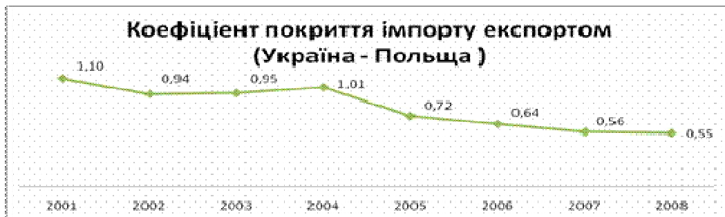
Рис. 1. Основні показники торгівлі України і Польщі (тис. дол. США)

В умовах інтенсифікації зовнішньоекономічних зв'язків та інтеграційних прагнень України надзвичайно актуальним є вивчення досвіду Польщі в реформуванні митної системи.